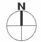
1층 평면도 축척: 1/200